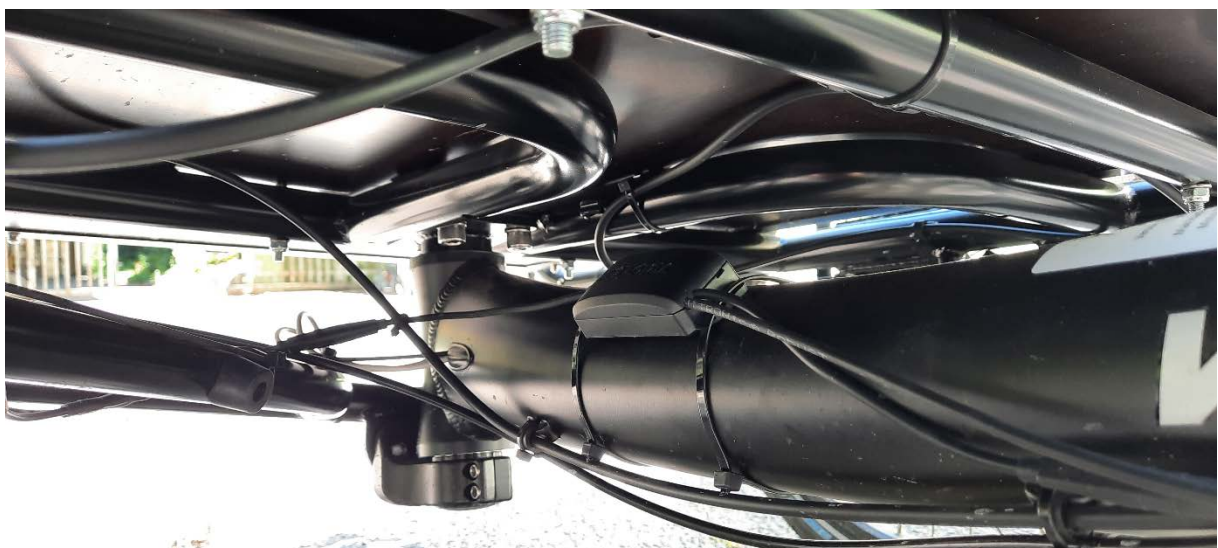
Abb. 4 Blick von links in Fahrtrichtung unter die Cargo-Box

Der vorgesehene Montageort für die Blinkerbox ist auf dem Rahmenrohr unter der Cargo-Box. Dort wird sie mit Kabelbinder zunächst provisorisch befestigt, um ihre Position später entsprechend der Kabellängen korrigieren zu können. Das 6-polige Anschlusskabel zeigt dabei nach vorn in Fahrtrichtung, das 3polige Anschlusskabel und das SV-Kabel zeigen nach hinten.